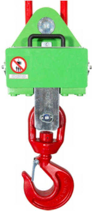
MCWHU: Sicht vom hinten