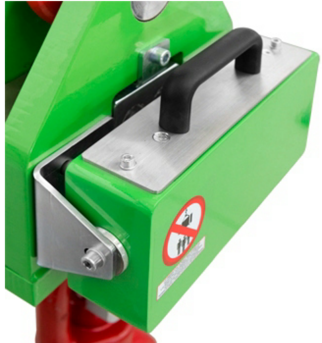
Serienmäßiges austauschbares Batteriefach