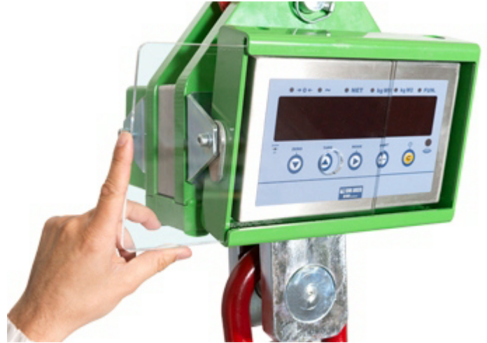
Schutzscheibe aus Plexiglas für Display und Tastatur